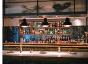
洗練された空間でディナーや食後の一杯を

アロハステーキハウスでカットされた高級ステーキ肉の端材を活用したハンバーガーや、店内で熟成した肉を手頃な価格で。クラフトカクテルやナチュラルワインの種類も豊富。軽食にもフルコースの食事にも使えるお店。