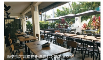
歴史指定建造物を改装した真珠の空間