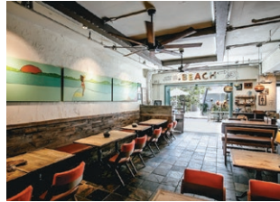
ビーチの雰囲気漂うおしゃれな店内