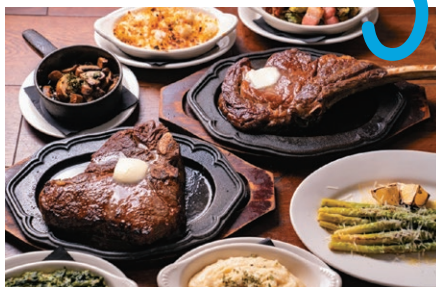
「これぞハワイ!」のステーキディナーを満喫しよう