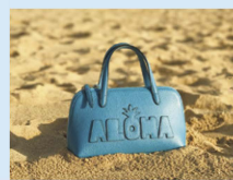
Art: Piccolo ALOHA $490

ALOHA のロゴはパイン のデザインで遊び心をメ ゾン譲りの仕上げで再 現する。ピッコロはミニ バッグのロゴ定番。