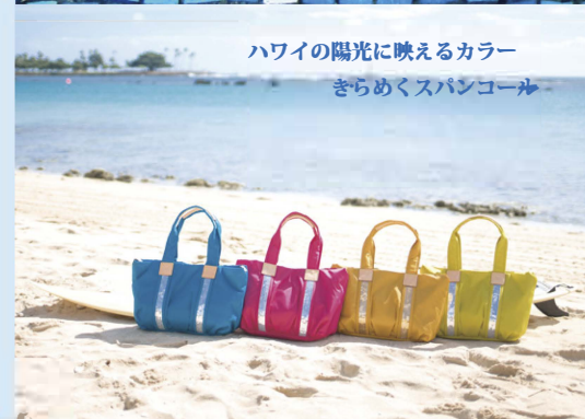
ハワイの陽光に映えるカラー きらめくスパンコール

ハワイならではのバッグを持って、ロコ気分で旅を重ねれば、 貴方もオハナの仲間入り!ハワイでの触れ合いを通じて ハワイに癒され、ロコ気分＝「アロハな習慣」を知ろう。